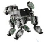
- DOGY หุ่นยนต์แบบสุนัขเดินแบบ 4 ขา