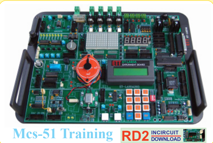
Mcs-51 Training RD2 INCIRCUIT DOWNLOAD